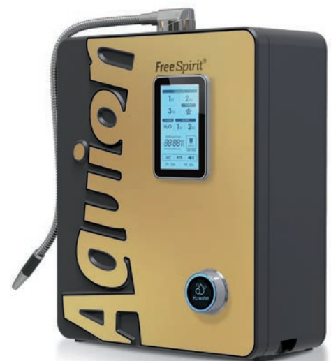
Neues Kapitel einer Erfolgsstory: Der Aquion FreeSpirit

Jetzt kann unser wichtigstes Lebensmittel, das Trinkwasser, gezielt moduliert werden – je nach Bedürfnis und persönlicher Lebenssituation. Dies macht das